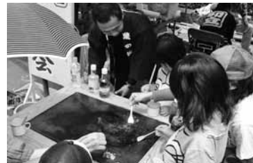
昔なつかし「もんじゃ焼」

示会・人力車乗車会や、昔懐かしい食べ物の販売等を企画しています。ご来場お待ちしております！