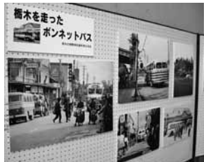
栃木の歴史写真展