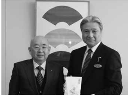
福田知事(右)を表敬訪問する岩下会頭(左)

去る1月16日、鈴木俊美 栃木市長、平池秀光県議 議員、当所岩下会頭、和賀 専務理事の4名が福田富一 栃木県知事を表敬訪問し、 栃木地区メデイカルセン ター計画事業についての支 援御礼並びに、栃木市環状 線県道栃木・小山線の事業 促進について要望活動を