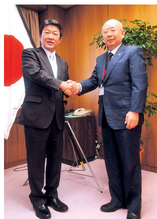
茂木大臣(左)を表敬訪問する岩下会頭(右)

去る1月11日、当所岩下会頭、北村会頭(県連会長)、島田会頭(佐野)、早川会頭(足利)の4名は、地元選出の茂木敏充衆議院議員が、昨年末に経済産業大臣に就任し、日本商工会議所の所管大臣となったことから、表敬訪問し、日本商工会議所「平成25年度税制改正に関する意見」重点項目についての要望書を提出した。要望書では、「抜本的な価格転嫁対策を実施すべき」として、消費税引き上げには、本格的で地方まで実感できる景気回復の実現が必須であるが、その場合にも、売上規模が小さな事業者ほど消費税分を価格転嫁できない実態を踏まえ、過去の引き上げ時を圧倒的に超える抜本的な価格転嫁対策を継続的に実施するよう要望した。