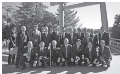
伊勢神宮にて記念撮影

初日は、それまで偶然の産物であった「真珠」を世界で初めて養殖に成功した、ミキモト創業者御木本幸吉氏の生涯と足跡を『真珠博物館』にて研修した。松月館長より、「御木本は、天然真珠乱獲により減少していたアコヤ貝の保護と増殖を目的に、養殖真珠を作り出す決意をした。その原動力は並々ならぬ努力と研究の賜であるが、明治天皇に拝謁した際に、「世界中の女性の首を真珠でしめてごらんにいれます」と申し上げ、有言実行するため己を鼓舞したようだ。また、事業成功の陰には、財界の重鎮・渋沢栄一氏との出会いも含め多くの人々の関わりが大きい。」と、逸話も交えた講話から、氏の高い志と真珠にかける情熱に感銘を受けた。