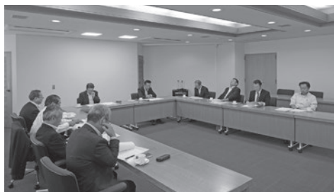
金融税務委員会開催風景