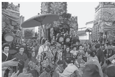
ふるさとまつり開催風景

また、「お囃子の競演」や「人形山車の引き出し」、特設会場では、「第38回栃木市の産業と物産展」・「秋季盆栽展」・「菊花展」のほか、「呑龍さま縁日」・「骨董市」・「歌麿まつり」等も同時開催され、更なる集客を得た。当所が主催となる産業と物産展では、栃木市制50周年を記念し、物販飲食、物販、展示の3エリアを設け、都賀町商工会・大平町商工会・藤岡町商工会・西方商工会・岩舟町商工会による市内全域の産業・物産品などを紹介・販売するコーナーも開設した。