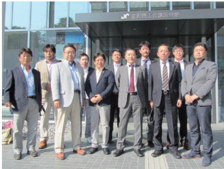
金沢商工会議所前で記念写真

初日は、日本3大名園のひとつである兼六園を訪れた。水戸偕楽園、岡山後楽園とならぶ日本三名園の一つであり、加賀歴代藩主により長い歳月をかけて形づくられてきた庭園を散策し、移りゆく秋の情緒を味わうことができた。続いて、卯辰山工芸工房を視察し、九谷焼や金沢泊をはじめとする金沢の伝統工芸に触れる機会となった。