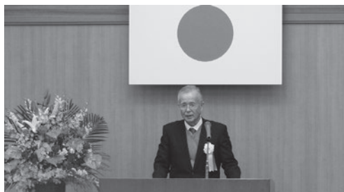
大川会頭 来賓挨拶