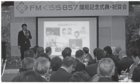
開局記念式典 開催風景

去る11月18日栃木市内において、「FMくら857」開局に伴う記念式典が開催された。栃木県内初のコミュニティFM局の開設となり、身近な情報の発信に加え、有事の際は防災放送の役割を備えた放送局となつている。今後のタイムリーな情報発信に期待が寄せられている。