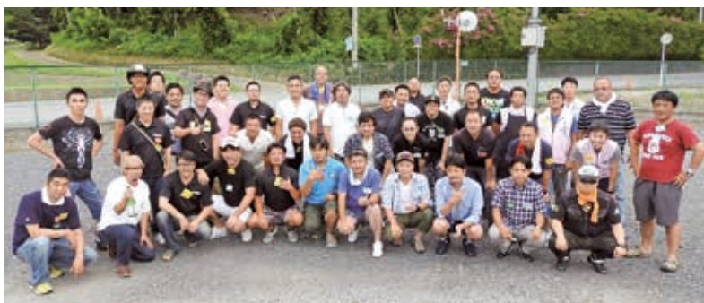
参加者全員での集合写真