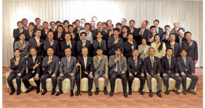
参加者による記念写真