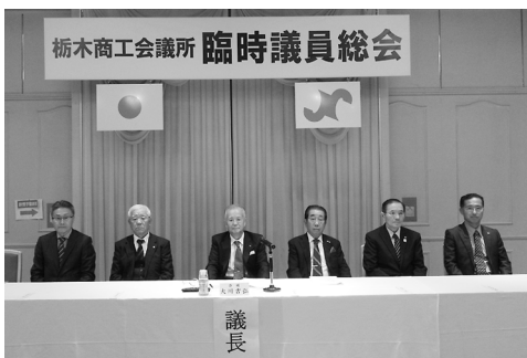
臨時議員総会=10月31日

10月12日に発生した台風19号は当所管内に甚大な被害をもたらした。当所では、被災直後より全会員に対し状況確認のアンケート調査や、特別相談窓口を開設し、早期の復旧・復興を目指す体制を強化した。 行政や関係機関と連携し、相談に対応するほか、当所が代表者となり「栃木商工会議所復興支援グループ」を組成し、県中小企業等グループ施設等復旧整備補助事業(グループ補助金)の計画の策定や申請等の支援を実施し、12月12日には、当所ホールにおいて説明会を開催し、多数の事業者が出席した。