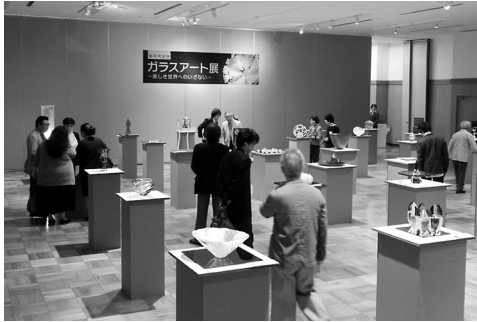
ガラスアート展=10月4日~12日

今年度は、5月に新元号が施行され、記念事業として「ガラスアート展」を開催した。また、第32期の任期満了に伴う議員改選が行われ、新議員による臨時議員総会を開催し、第16代荒金会頭が指名推薦された。そのような中、10月に台風19号が発生した。管内においても甚大な被害が発生し、災害からの早期復旧を目指す支援策を活用するための説明会を実施するなど、地域振興に向け積極的に推進した。