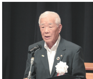
大会宣言(案)を読み上げる若菜副会頭