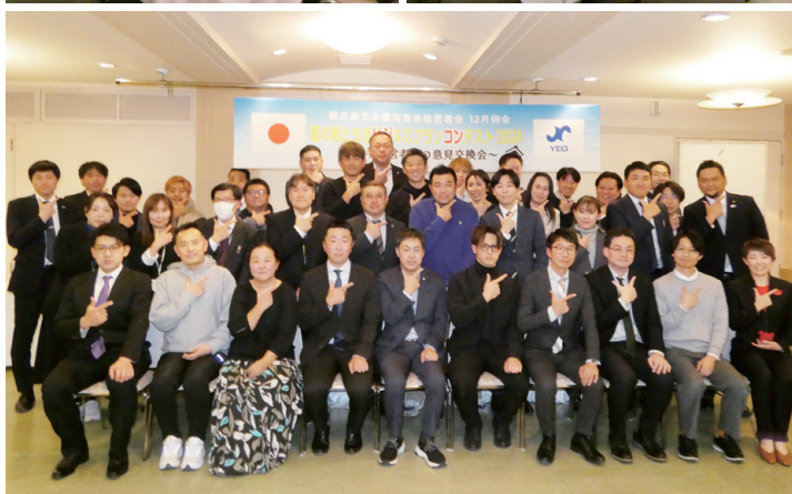
令和6年度の開催風景