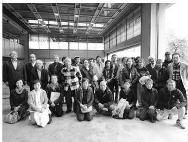
常磐ホテル エントランス

当日は11月並みの寒さとなったが、見学地やバス車内では、会員同士の会話も弾み終始和やかな雰囲気の日となった。 令和4年から4回目を迎えた会員旅行であったが、次回も期待を超えるような企画につとめるのでご期待を。