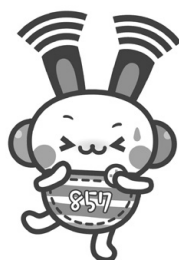
FMくらら857キャラクター くららん