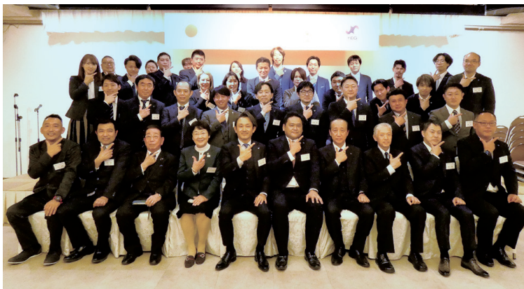
参加者による集合写真