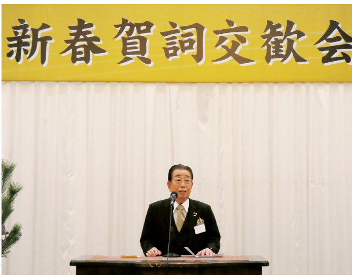
荒金会頭 開式のことば

であった。これまでの合併効果を活かし、河川の上流から下流までが一体となった災害に強いまちづくりを推進してきた。本年は、栃木IC周辺の開発に向け、財源の確保や雇用創出を図り、全力で駆け抜けてまいりたい。」と挨拶された。