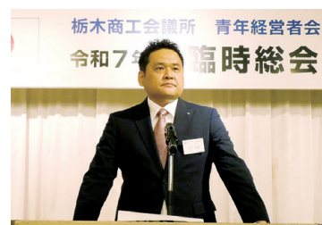
市川次年度会長予定者挨拶