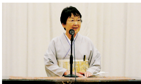
大川市長 主催者代表挨拶

開会にあたり、荒金会頭は、「本年は、十干十二支で『丙午』の年にあたり、物事が大きく動き挑戦が実を結ぶ年、本市経済のさらなる活力ある発展を目指し、皆様と共に明るく前向きな一年にしてまいりたい。」と開式のことばを述べられた。