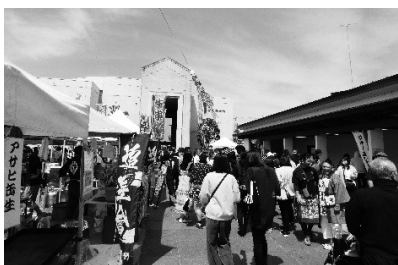
山車会館前広場の様子

また、とちぎ蚤の市、ミツワキッチンカー通りが同時開催されます。ご家族で楽しめるイベントが盛りだくさんです。ぜひお出かけください。