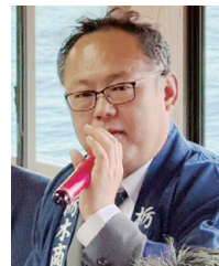
〈思いを語る卒業生〉